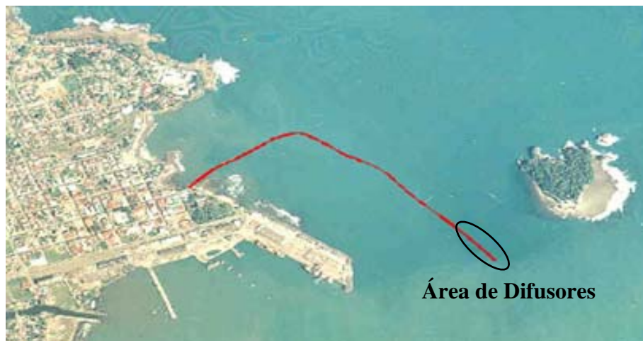
Figura 1. Tramo final del Emisario Submarino (área de difusores).

Se alquiló una lancha similar a la del año pasado para el traslado de los buzos a los distintos puntos de inmersión. Los tanques de aire adquiridos por AyA como parte del equipo de buceo fueron llenados en San José y trasladados a Limón, ya que en Limón no hay estaciones de buceo.