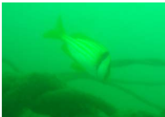
Fotografía 2. Peces en el ecosistema generado por el Emisario Submarino.