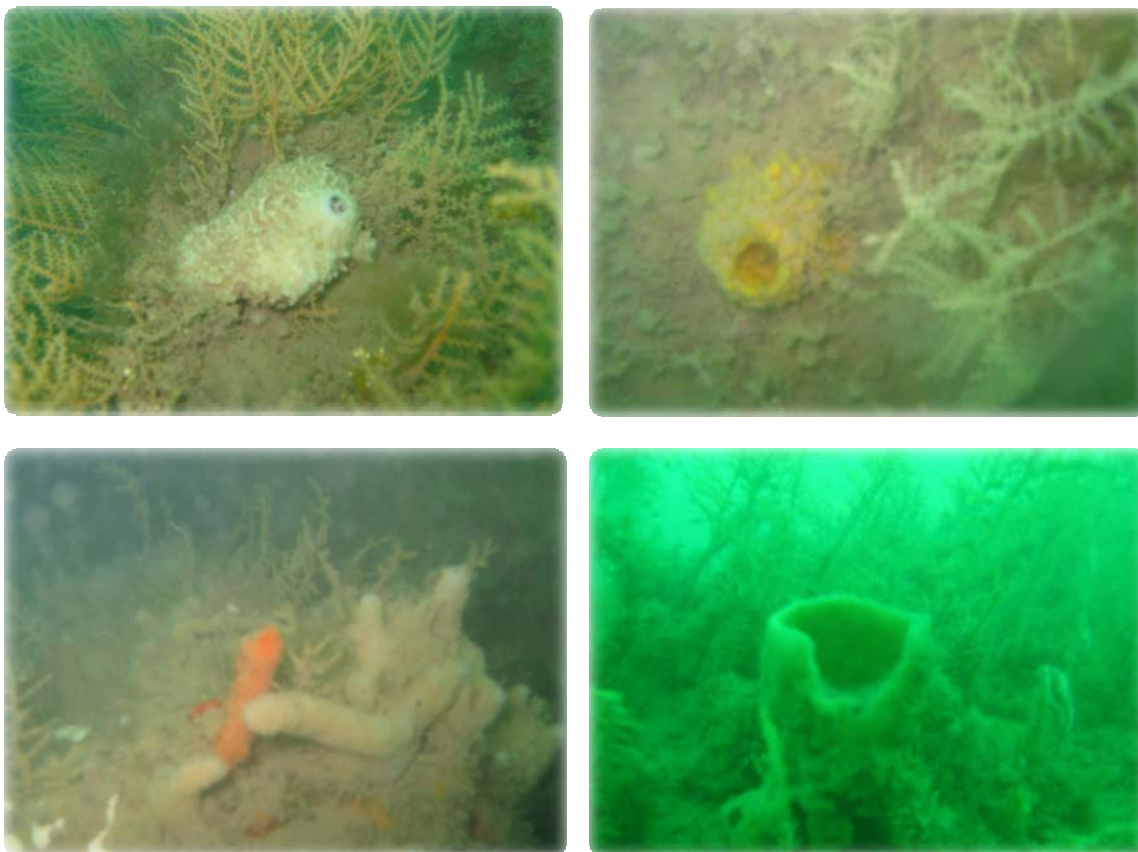
Fotografía 1. Flora y fauna encontrada sobre la tubería y anclajes de concreto.

Se ubicó la tubería y se inició la inspección hacia el extremo donde está la descarga, durante ese recorrido se observó que la vida que cubre este tramo de la tubería es diferente a la que cubre la mayor parte de la tubería ya inspeccionada en ocasiones anteriores. Anteriormente se encontró una formación dura de color blanco y en este último tramo se aprecian algas, algunos peces y otros organismos, los cuales se aprecian en las Fotografías 1 y 2 .