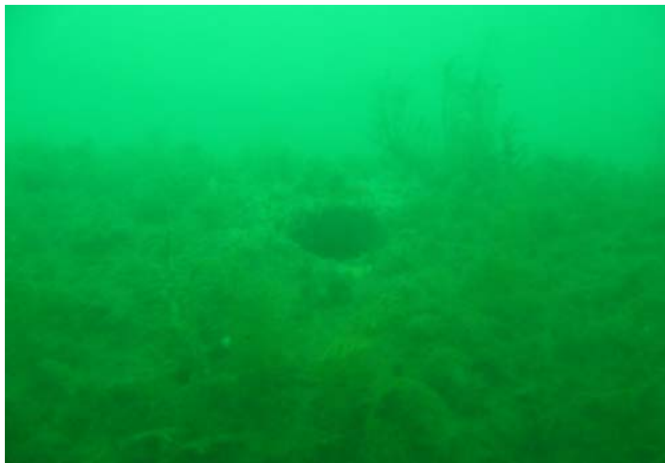
Fotografía 3. Ubicación de los difusores sobre la tubería.

En los planos constructivos del Emisario Submarino se mencionan 30 difusores de 7,5 cm de diámetro ( ver Fotografía 4 ) ubicados cada 4 m, sin embargo, en esta inspección se localizaron 14 difusores en lugar de 30 y se confirmó el diámetro y distancia entre ellos, lo cual sí correspondía a los planos. En la Fotografía 4 se aprecia el espesor de la tubería de polietileno de alta densidad que es de aproximadamente una pulgada.