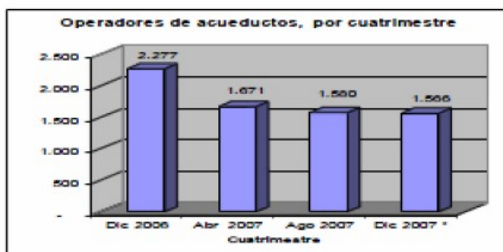
Gráfico No. 1