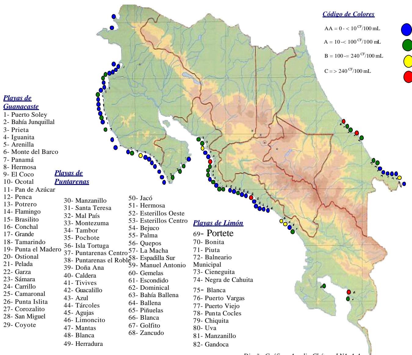
FIGURA 1. PLAYAS DE COSTA RICA: CLASIFICACION MEDIANTE EL CODIGO DE COLORES EN EL PERIODO 1998-2002

*Incluye las playas de la ciudad de Puntarenas más El Roble y 36 del resto de la provincia.